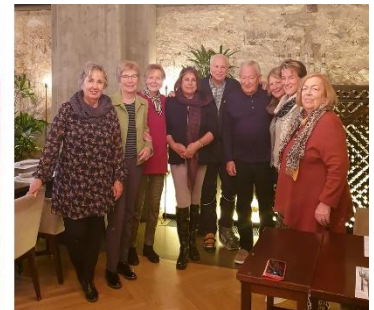
v.l. Regionalgruppe Tessin / Regionalgruppe NW-Schweiz / Regionalgruppe Solothurn